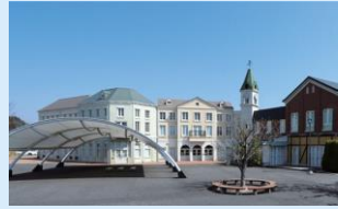
東京電力廃炉資料館

福島第一原子力発電所の廃炉状況を巨大なスクリーンや床を使った映像の投影など、最新技術を使いわかりやすく説明・展示している施設です。