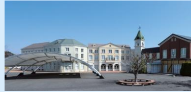
東京電力廃炉資料館

福島第一原子力発電所の廃炉状況を巨大なスクリーンや床を使った映像の投影など、最新技術を使いわかりやすく説明・展示している施設です。