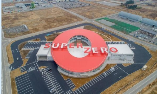
浅野燃糸大規模生産工場：SUPER ZERO